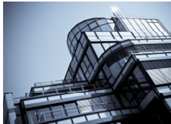
Dort OBEN residieren SIE