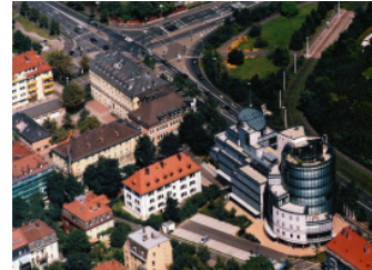
EURO CENTER VON OBEN