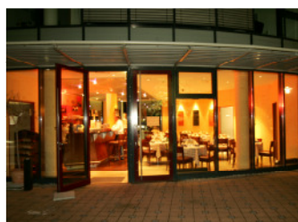
Ristorante Da Toni, im EG