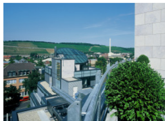
Blick zur / von Dachterrasse