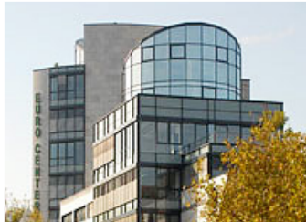
EURO CENTER IM HERBST