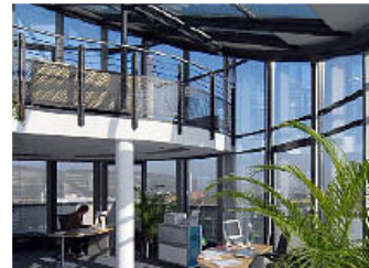
Penthouse-Büro mit Galerie