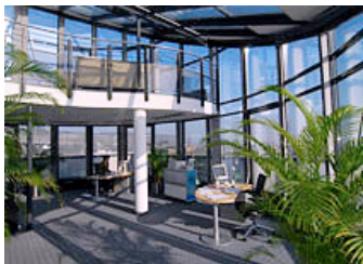
Penthouse mit Weitblick