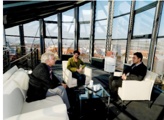
Besprechung mit „Weitblick“