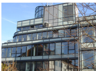
Ihr Penthouse ganz oben